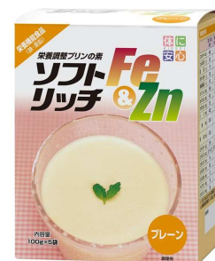
ソフトリッチFe&Zn プレーン (栄養機能食品 鉄・亜鉛)