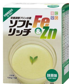
ソフトリッチFe&Zn 抹茶味 (栄養機能食品 鉄・亜鉛)