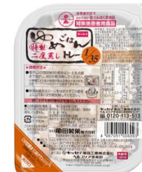
ゆめごはん1/35トレー