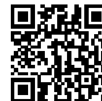
減塩げんたしょうゆ